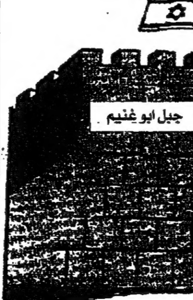
جبل أبو غنيم

منذ ان حول اتفاق اوسلو منظمة التحرير الفلسطينية الى طرف مفاوضات سياسية مع اسرائيل، فقد توترت اسرائيل، وسيدانان معالجة قضية القدس، ان لا تتسبب في اضرار على الارض ليست تحدى.